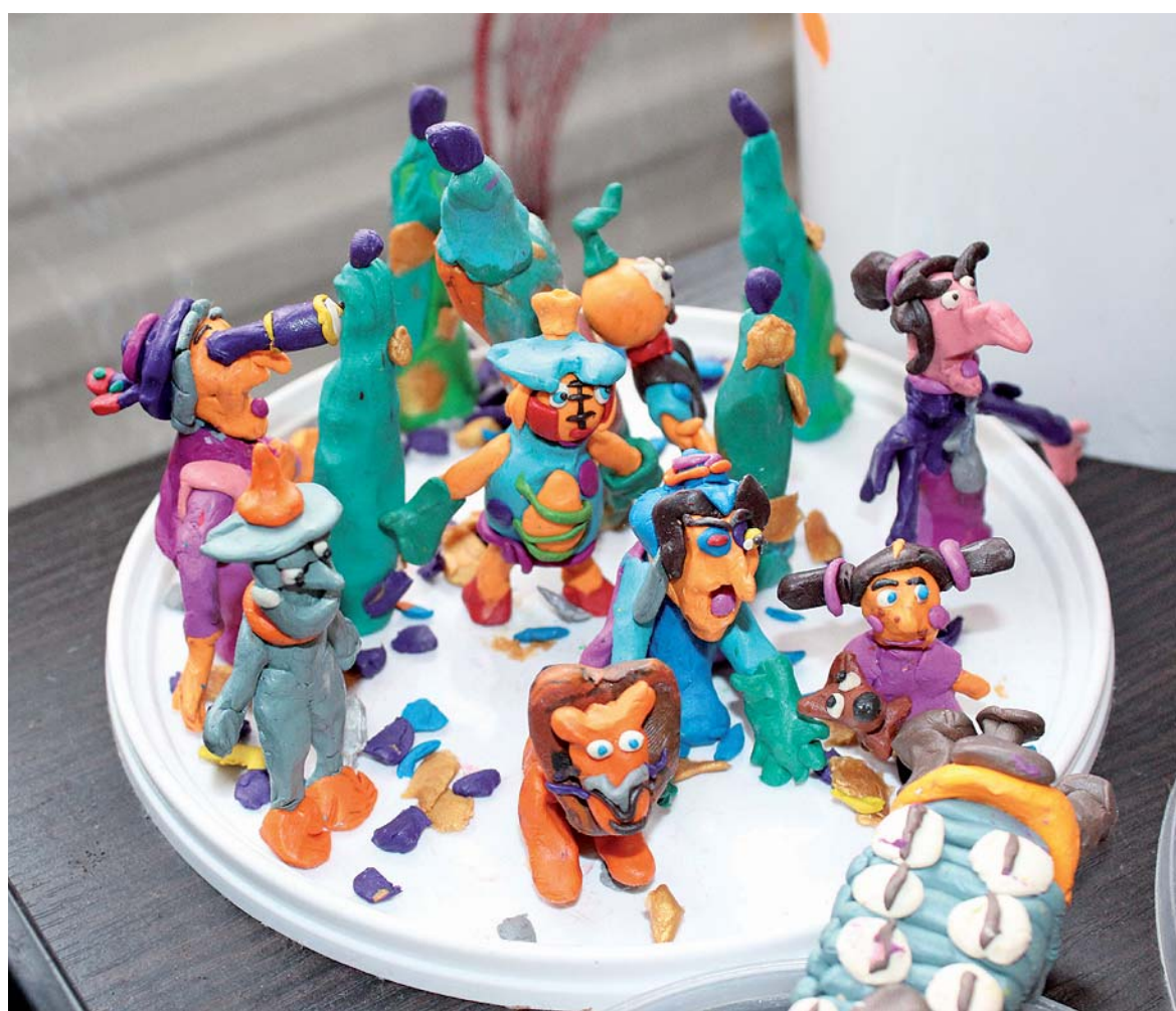
Герои сказки «Волшебник изумрудного города» живут своей пластиновой жизнью.