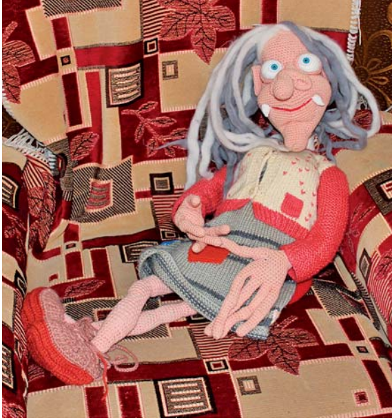
Моя вязаная Баба Яга живёт в Ляпуново уже целый год. А вот вчера довелось познакомиться с её хозяином. Могу сказать моей Бабе Яге очень повезло!